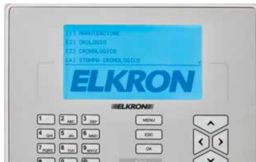
BLU Sistema in manutenzione/ programmazione