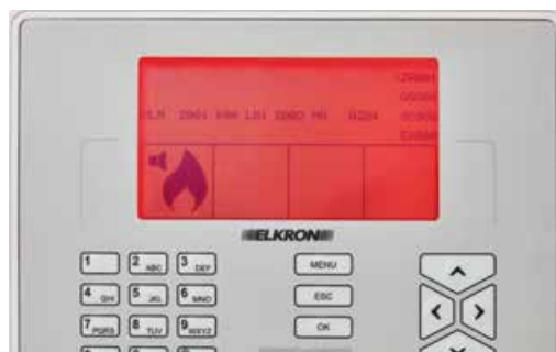
ROSSO Sistema in allarme