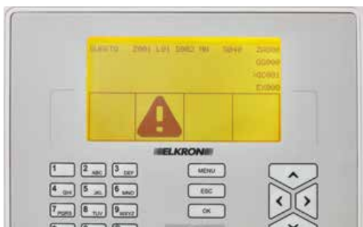
GIALLO Sistema in guasto/anomalia