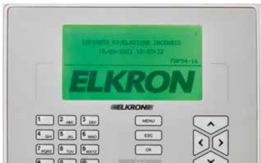
VERDE Sistema OK

Il nuovo display RGB evidenzia gli stati della centrale con colori diversi. I colori semplificano il lavoro di chi installa poichè rendono facilmente riconoscibile la condizione in cui si trova l'impianto e l'individuazione di eventuali guasti o allarmi in corso. Anche quando non è in prossimità del dispositivo.